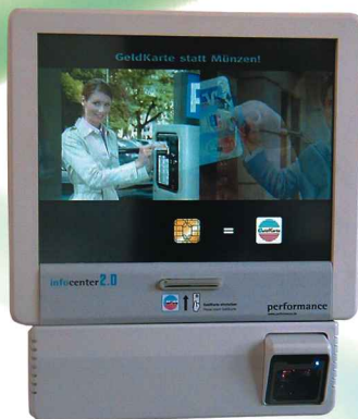
Display PC Wandgerät mit Extras Abmessungen (H*B*T): 42,2cm*36,5cm*7cm Artikel Nr. 58508